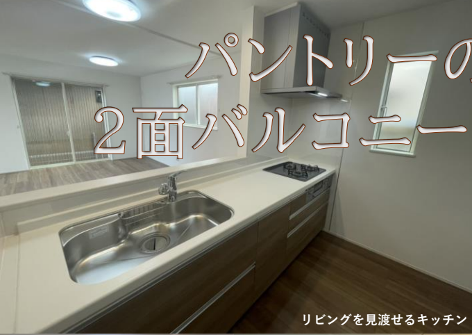
リビングを見渡せるキッチン