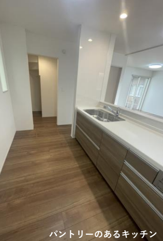
パントリーのあるキッチン