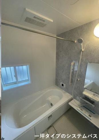
一坪タイプのシステムバス