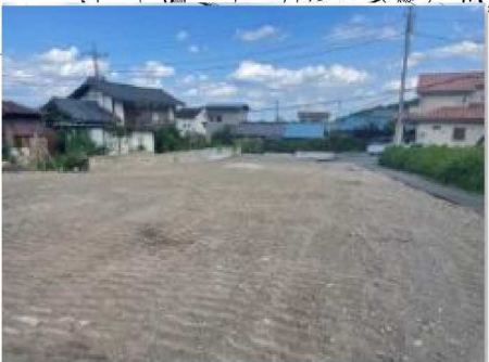
※図面と現況が異なる場合は現況を優先します